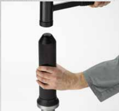
Правильная работа инструмента для монтажа подшипников.